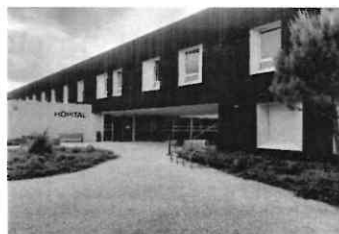
CENTRE HOSPITALIER Quartier Mazorel Nord Rue Paul Goy 26400 CREST

Ses agents pourront vous renseigner ou vous orienter vers le professionnel concerné.